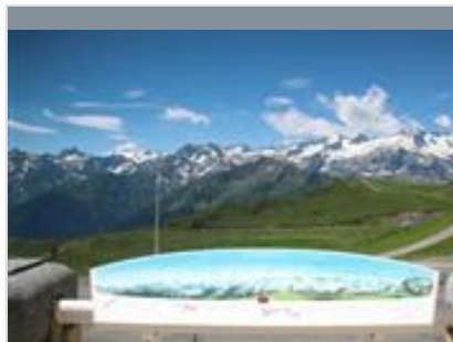
TABLE D'ORIENTATION DE SUPERBAGNÈRES